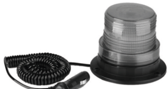
Flash Pattern Changing Switch