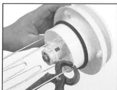
VT-100 / S-100