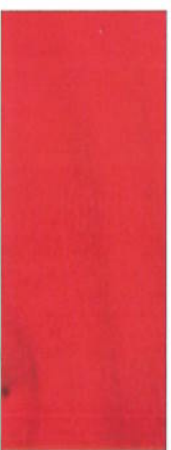
154, SP 154 Hellrot auf Ahorn