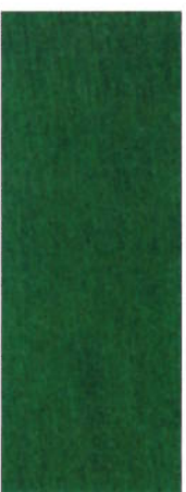
158 Dunkelgrün auf Ahorn