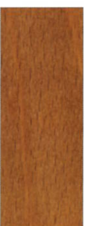
171 Kirschbaum auf Buche