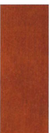
175, SP 175 Kirschbaum dunkel auf Ahorn