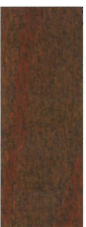
167, SP 167 Nußbaum mittel auf Buche