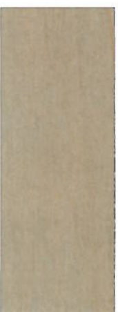
161, SP 161 Hellgrau auf Ahorn