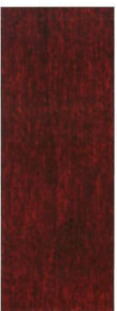
156 Mahagoni auf Ahorn