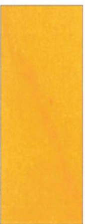
152 Gelb R auf Ahorn