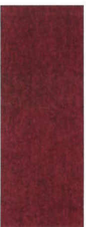
159 Violett auf Ahorn