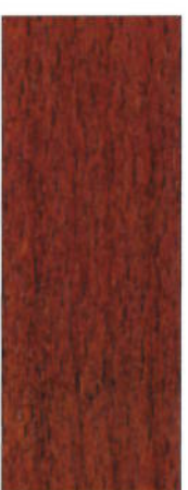
169, SP 169 Mahagoni hell auf Buche