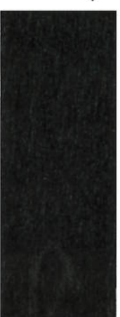
174, SP 174 Schwarz auf Ahorn