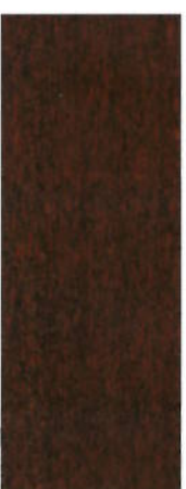
168, SP 168 Nußbaum dunkel auf Buche