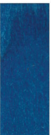
160 Blau auf Ahorn