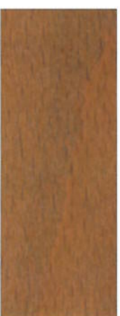
166, SP 166 Nußbaum hell auf Buche