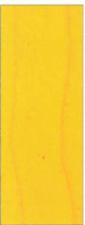
151, SP 151 Gelb G auf Ahorn