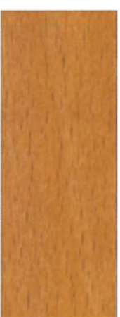
172 Birnbaum auf Buche