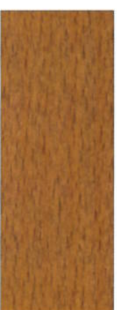
173, SP 173 Teak auf Buche