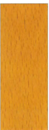
163, SP 163 Eiche hell auf Buche