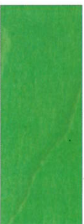
157, SP 157 Hellgrün auf Ahorn