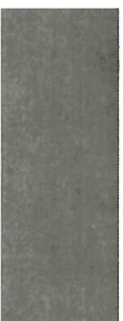
162 Dunkelgrau auf Ahorn