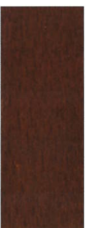
165, SP 165 Eiche dunkel auf Buche