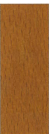
164, SP 164 Eiche mittel auf Buche