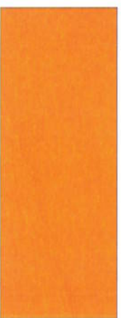
153, SP 153 Orange auf Ahorn