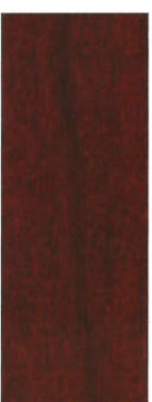
170, SP 170 Mahagoni dunkel auf Buche